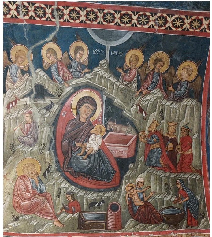
Detail van muurschildering Agios Nicolaos, Cyprus

Zoals sterren mensen melden dat geen nacht te donker is zal een kind ons komen redden dat het licht der wereld is.